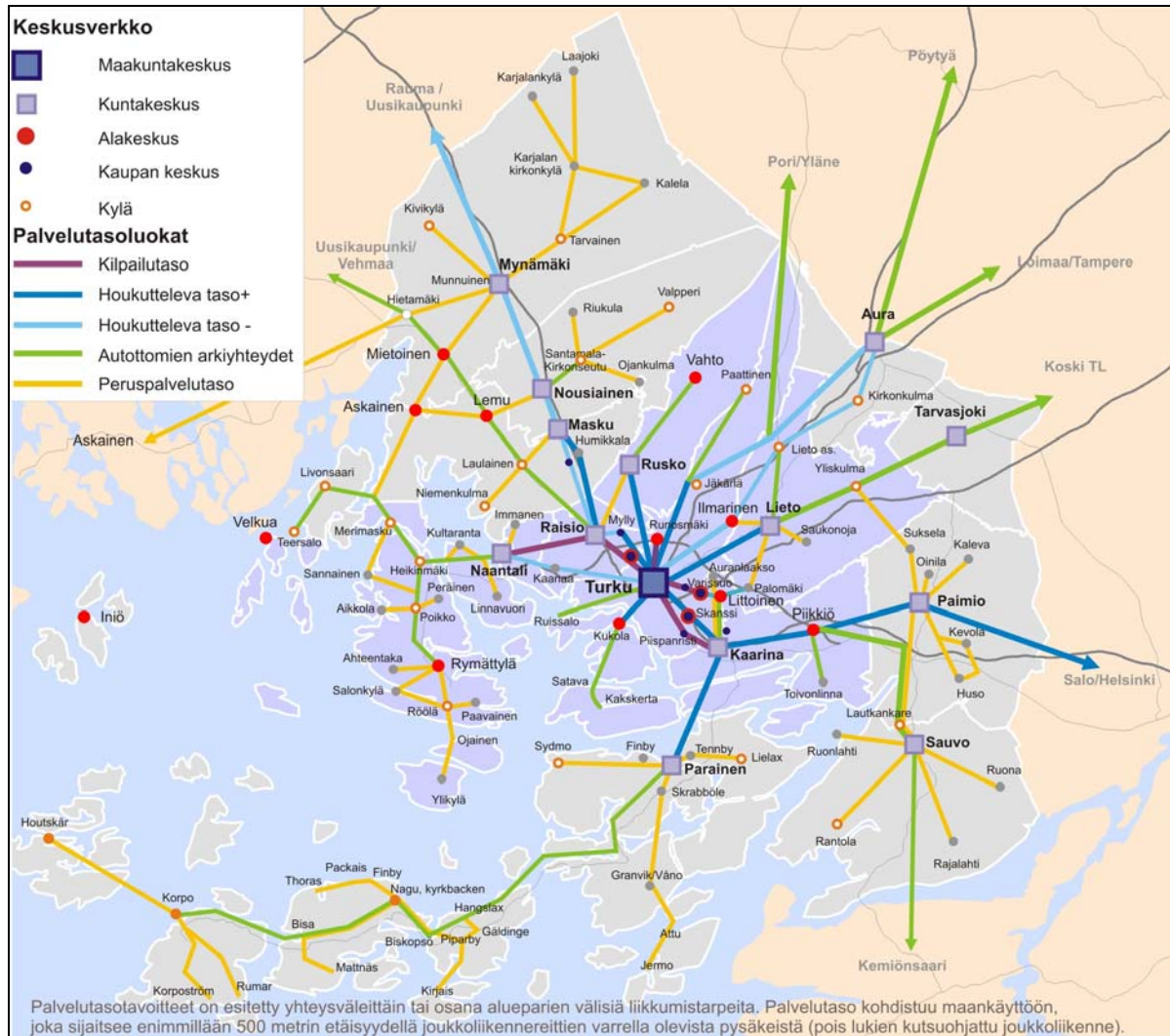
Kuva 1. Turun seudun palvelutasotavoitteet yhteysväleittäin