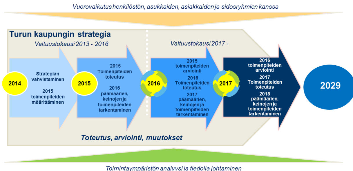
Kuva 2: Jatkuva parantaminen.

rämuotoista sovittujen toimenpiteiden toteutusta sekä saavutettujen hyötyjen arviointia. Jatkuva parantaminen etenee vuosittain toistuvana prosessina, jossa toimenpiteiden toteutus, hyötyjen arviointi sekä päämäärien, keinojen ja toimenpiteiden tarkentaminen seuraavat toisiaan. Hyötyjen arviointia tehdään tiiviissä ja avoimessa yhteistyössä kaupungin henkilöstön, asukkaiden, asiakkaiden ja sidosryhmien kanssa.