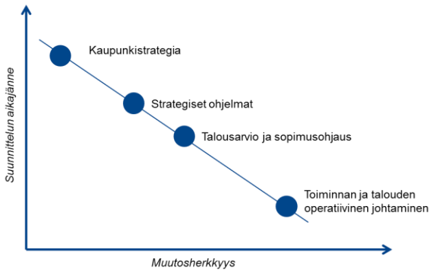
Kuva 3: Strategisen suunnittelun aikajänne ja muutosherkkyys.