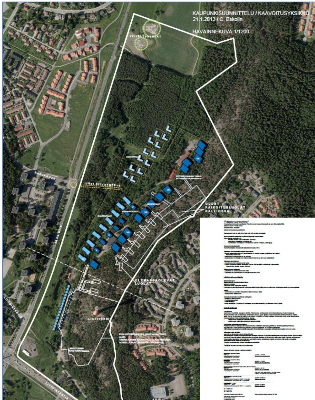
Liite 1. Alustava luonnossuunnitelma.

Alustava luonnoskuva yleisötalouksissa 31.5.2011, 4.9.2012 ja 21.1.2013 ja näistä tulleet mielipiteet.