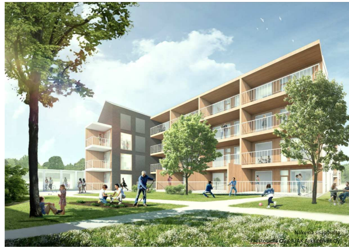
Näkymä sisäpihalta Prestobella Oy / AJAK Arkkitehdit Oy