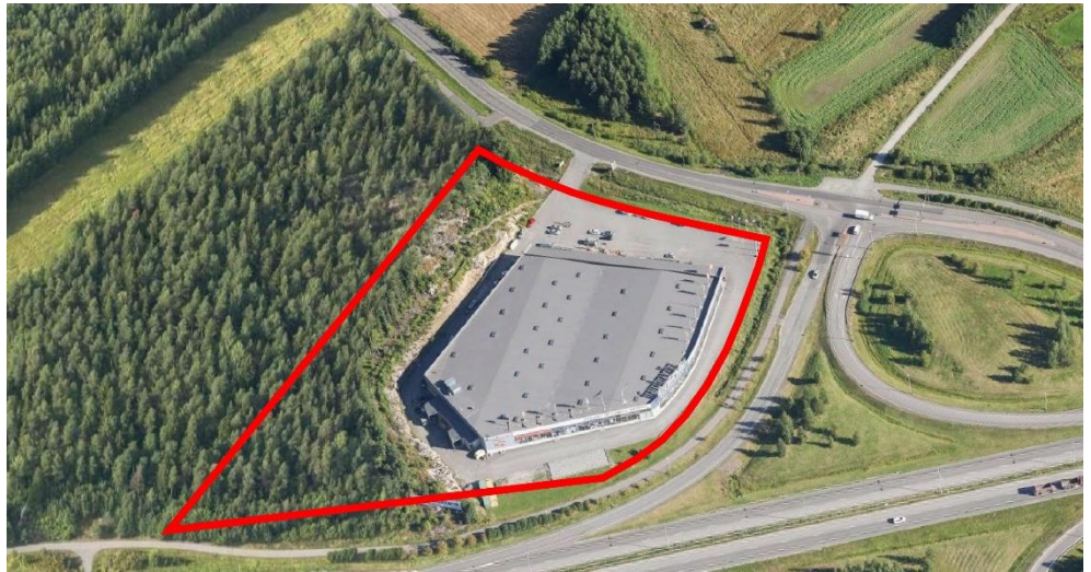
Viistoilmakuva alueesta

Tontilla sijaitsee käytössä oleva liikerakennus piha-alueineen. Ruusunmarjanpuisto on metsäpeitteinen pieni kallioselänne. Ruusunmarjanpuiston länsireunalla on Raision kunnan raja. Raision puolella kallioselänten alueelle ja sen ympäristöön on laadittu asemakaavanmuutos, jolla mahdollistetaan selänten ja sen lähialueiden ottaminen rakentamisalueeksi, sekä tonttialueiden välinen toiminta yli kuntarajan kahdella ajoyhteydellä.