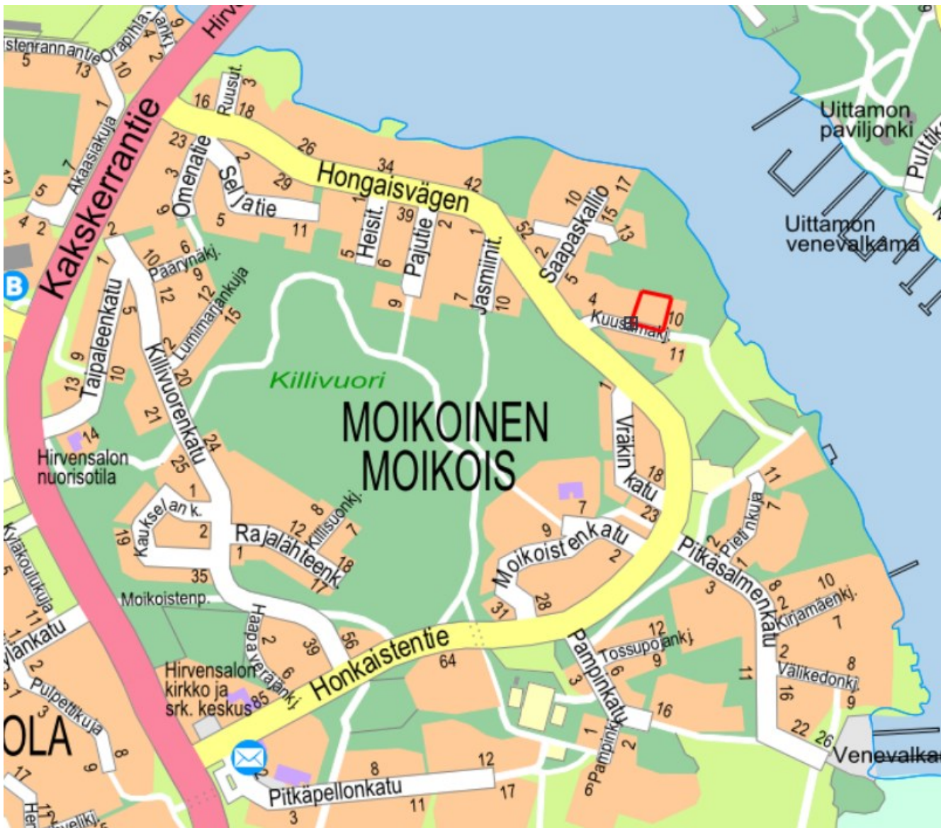
Kuva 1. Kaava-alueen sijainti osaskartalla.

Kaupunginosa: Moikoinen Osoite: Kuusamakuja 8