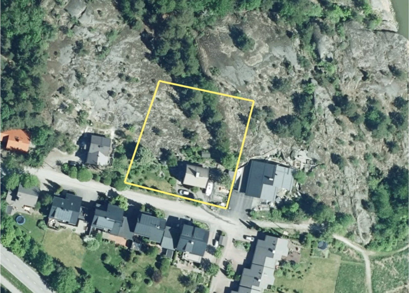
Kuva 2. Ilmakuva muutosalueesta.

Suunnittelualue on yksityisten aloitteidentekijöiden omistuksessa.