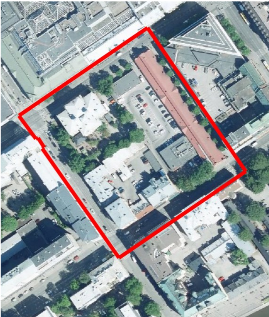
Kuva 2. Kaava-alueen ilmakuva

Kaava-alueen lähialueella, korttelin länsipäässä on pääosin 1960- ja 80-luvulla rakennettuja liike-, toimisto- ja asuinrakennuksia mm. KOP-kolmio. Osoitteessa Aurakatu 6 on vireillä kaavamuuksio tontin käytön tehostamiseksi liike-, toimisto- ja asuinkäyttöön.