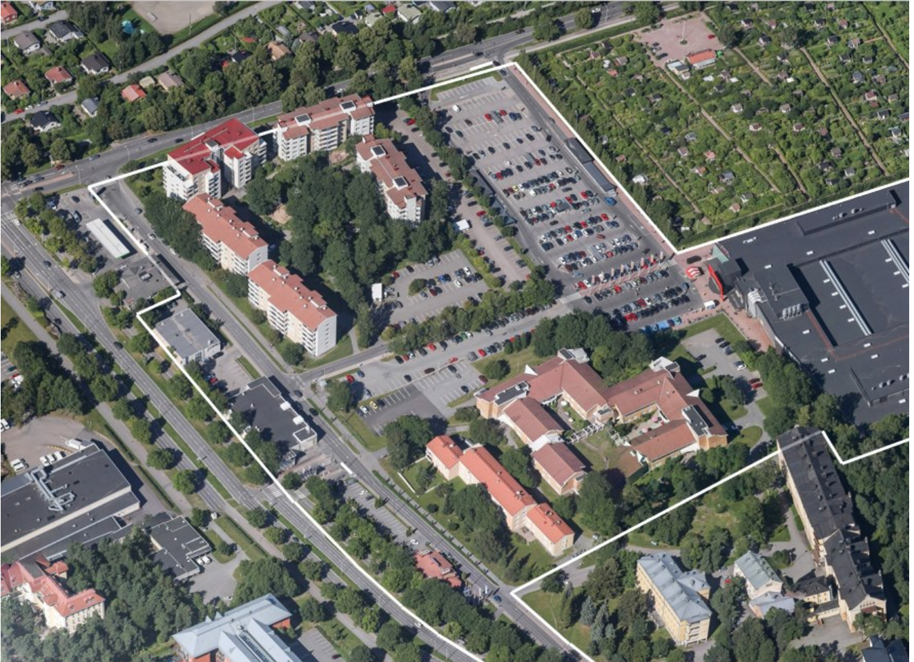
Kuva 2. Ilmakuva (suunnittelualue valkoisella rajauksella).

Alueen yhdeksästä tontista kolme on kaupungin omistuksessa. Yksi kaupungin tonteista on vuokrattu pitkäaikaisella vuokrasopimuksella Kesko Oyj:lle ja tontilla toimii Kupittaaan Citymarket. Kurjenmäenkadun ja Kaskentien välisellä alueella on liikerakennuksia ja Kingelininkadun ja Kunnallissairaalan välissä asuinrakennuksia. Kingelininkadun eteläpuolella toimii vanhustaloyksikkö Kurjenmäkikoti sekä Tyksin psykiatrian toimialueen yksikkö.