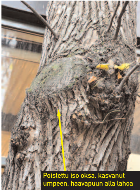
Poistettu iso oksa, kasvanut umpeen, haavapuun alla lahoa