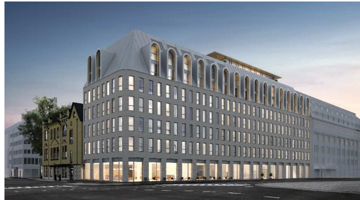
HAVAINNEKUVA EERIKINKADULTA SCHAUMAN ARKKITEHDIT OY