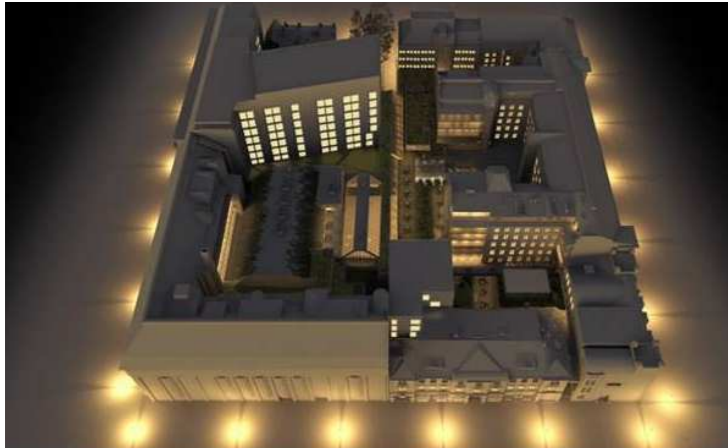
HAVAINNEKUVA SCHAUMAN ARKKITEHDIT OY