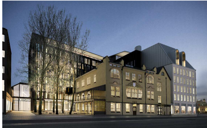
HAVAINNEKUVA KAUPPIASKADULTA SCHAUMAN ARKKITEHDIT OY