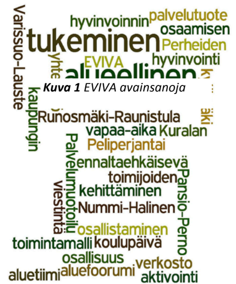
Kuva 1 EVIVA avainsanoja

Suurin osa hankkeelle vuodelle 2014 varatusta rahoituksesta on mennyt palvelujen ostoihin ja henkilöstökuluihin. Palvelujen ostot pitävät sisällään uusiin palvelutuotepilotteihin, viestintään, osaamisen tukemiseen ja asukkaiden