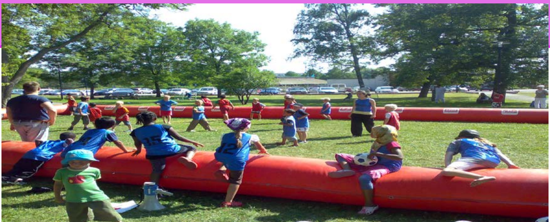
Kuva :Monikulttuurinen liikuntailtapäiväkerhon – hankkeen Koulukiertue (kevät 2014)