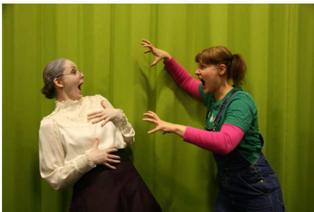
Keltanokat ja konkarit, kuva: Päivi Autere.

Lukulampun valossa -hanke osallistui myös juhluvuoden ohjelman järjestämiseen. Keltanokat ja konkarit oli hankkeen puitteissa toteutettu, esikouluikäisille ja varttuneemmalle väestölle suunnattu tapahtuma, jonka aiheena oli lastenkirjallisuus ja kirjasto aikojen saatossa. Viisi kertaa järjestetty tilaisuus alkoi noin vartin pituisella näytelmällä, jota seurasi keskustelua ja muisteluja kirjastokäynneistä, kirjaston esineistöstä sekä keltanokkien ja konkarien suosikkilastenkirjoista.