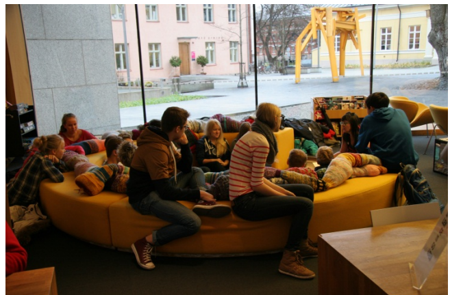
Yläkoululaisia Runoviikon murrerunokylvyssä, kuva: Jenni Valta.