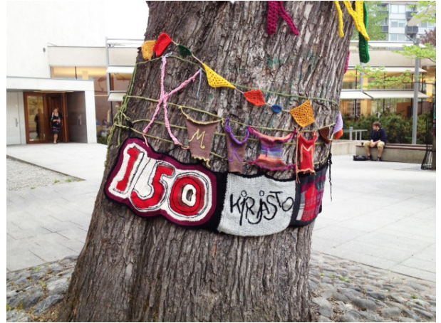
Taiteiden yön poistokirjamarkkinat, Knit'n'Tag, kuvat: Pauliina Sandberg.

Kirjaston ja Museokeskuksen yhteisenä hankkeena toteutettiin Turun linnaan näyttely Enemmän kuin tuhat sanaa . Marraskuussa avatussa näyttelyssä pääsi tutustumaan minkälaisissa oloissa kirjojen sankarit ovat eläneet sekä miten eri tavoin linnaa ja sitä ympäröivää maisemaa on eri taiteenlajien keinoin esitetty. Yhteistyössä Museokeskuksen kanssa julkaistiin myös vinkkivihko Turku lasten- ja nuortenkirjallisuudessa .