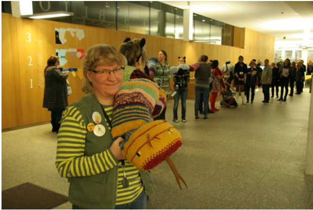
Alkupamaus pääkirjastossa, kuva: Päivi Autere.

Juhlavuoden ohjelman puitteissa järjestettiin n. 150 tapahtumaa ja niissä oli yli 100 esiintyjää. Näyttelyjä järjestettiin kahdeksan, joista kaksi levittyi koko pääkirjastoon ja yksi koko vuoden ajalle. Juhlavuoden ohjelmaan osallistui yhteensä yli 6500 kävijää.