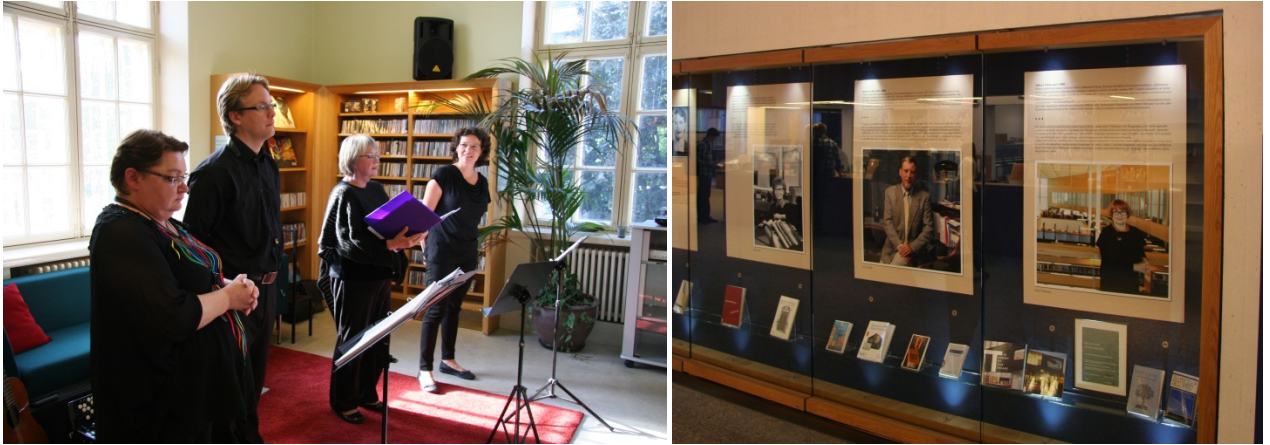
Lauluryhmä esitti juhlavuoden tilaisuuksissa Arkkiveisuja ja kansanballadeja, näyttelyssä esiteltiin 150-vuotiaan kirjaston historiaa ja toimintaa

Juhlavuoden aikana järjestettiin pääkirjastossa kaksi kirjaston historiaa esittelevää näyttelyä, joista ensimmäinen keskittyi kirjaston perustamiseen ja alkuvuosiin, toinen esitteli kirjaston toimintaa läpi vuosikymmenten. Tammikuun näyttelyn teemana oli Tietämättömyyttä vastaan , ja siihen liittyi professori Matti Klingen luento aiheesta. Syyskuussa pääkirjaston eri osastoille levittäytyi näyttelykokonaisuus teemalla Laina-aikaa 150 vuotta .