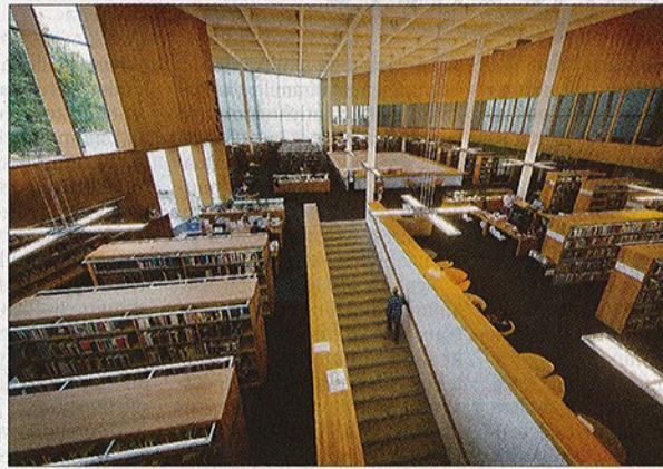
Turun pääkirjaston toisessa kerroksessa ovat tietokirjat.

Turussa sähkökirjojen nimikkeitä on vasta muutamia satoja. Näätsaari usko, että sähkökirjat ovat pian ratkaisevassa osassa.