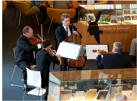
Turun filharmonisen orkesterin jousikvartetti pääkirjaston tieto-osastolla, kuva: Arto Takala.

Merkkivuosi käynnistyi Alkupamauksella 9. tammikuuta. Tapahtuma oli flashmob-tyyliin järjestetty yllätys asiakkaille. Kirjaston henkilökunta muodosti pääkirjastoon "kirjastomadon" eli jonon, josta käsin asiakkaille jaettiin muistivihkoja ja karamelleja sekä luettiin ääneen ja laulettiin.