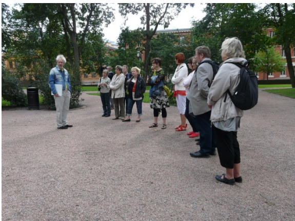
Kirjailijakävelyillä esiteltiin Turussa tai Turusta kirjoitettua kirjallisuutta.

Alkuperäisen ohjelmasuunnitelman lisäksi toteutettiin julkaisuhanke Turun kaupunginkirjasto tunnissa. Kirjaston historiaa, nykypäivää ja ammattisanastoa avaava tietopaketti toimitettiin kirjaston henkilökunnan toimesta heinä-elokuussa ja julkaistiin syyskuussa Lingsoftin One-Hour Words -julkaisusarjassa. Julkaisun sähköiset versiot (e-kirja, mobiiliversio ja äänikirja) ovat laadittavissa osoitteessa: www.onehourwords.com/fi/node/5 .