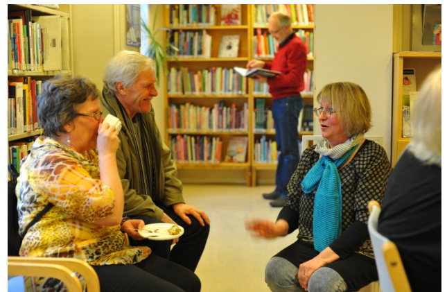
Minun kirjastoni: Moision kirjasto (vas.) ja Maarian kirjasto (oik.)