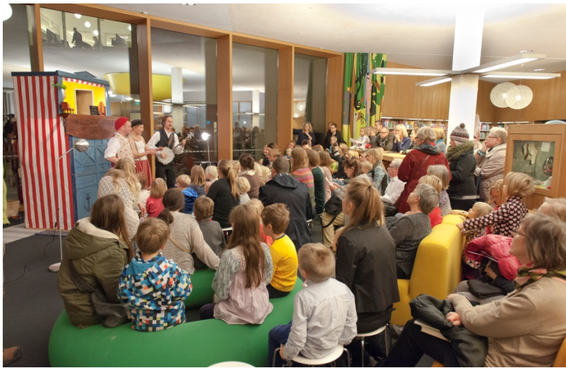
Juhlavuoden Kaamos-tapahtuman ohjelma oli suunnattu varsinkin lapsille ja nuorille.