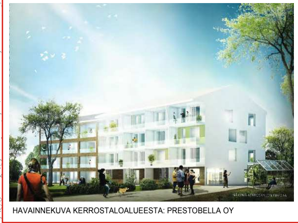
HAVAINNEKUVA KERROSTALOALUEESTA: PRESTOBELLA OY