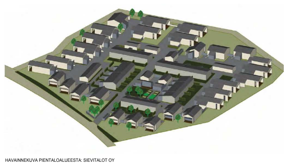
HAVAINNEKUVA PIENTALOALUEESTA: SIEVITALOT OY