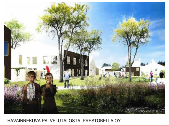
HAVAINNEKUVA PALVELUTALOSTA: PRESTOBELLA OY