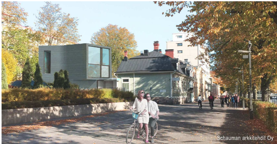
Schauman arkkitehdit Oy