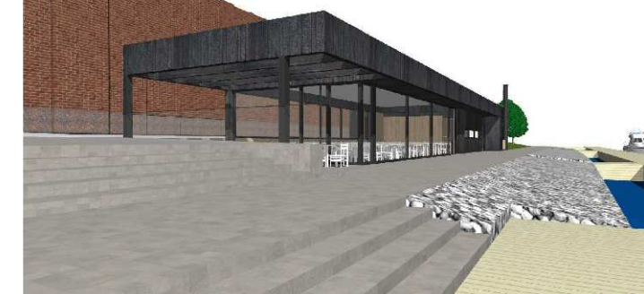
Havainnekuva Arkkitehtitoimisto Haroma & Partners

katutilaan. Alueella on käytettävä samoja tai laatuolosuhteita vastaavia materiaaleja kuin viereisellä katualueella.