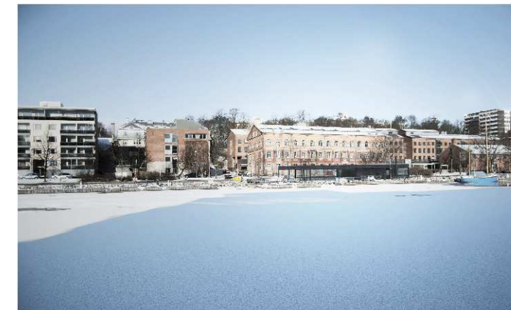
Havainnekuva Arkkitehtitoimisto Haroma & Partners

katutilaan. Alueella on käytettävä samoja tai laatuolosuhteita vastaavia materiaaleja kuin viereisellä katualueella.