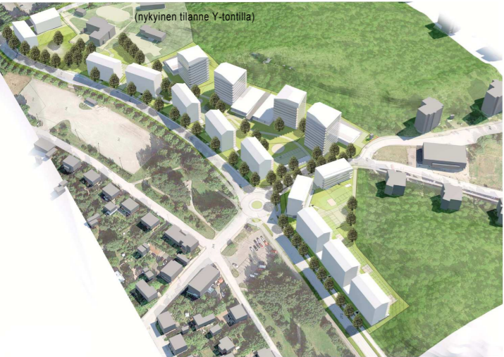
HAVAINNEKUVA, NÄKYMÄ LÄNNESTÄ