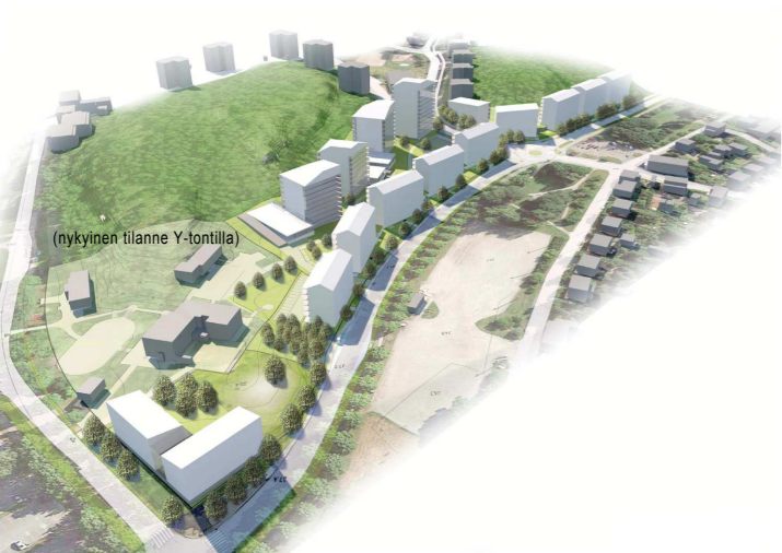
HAVAINNEKUVA, NÄKYMÄ POHJOISESTA