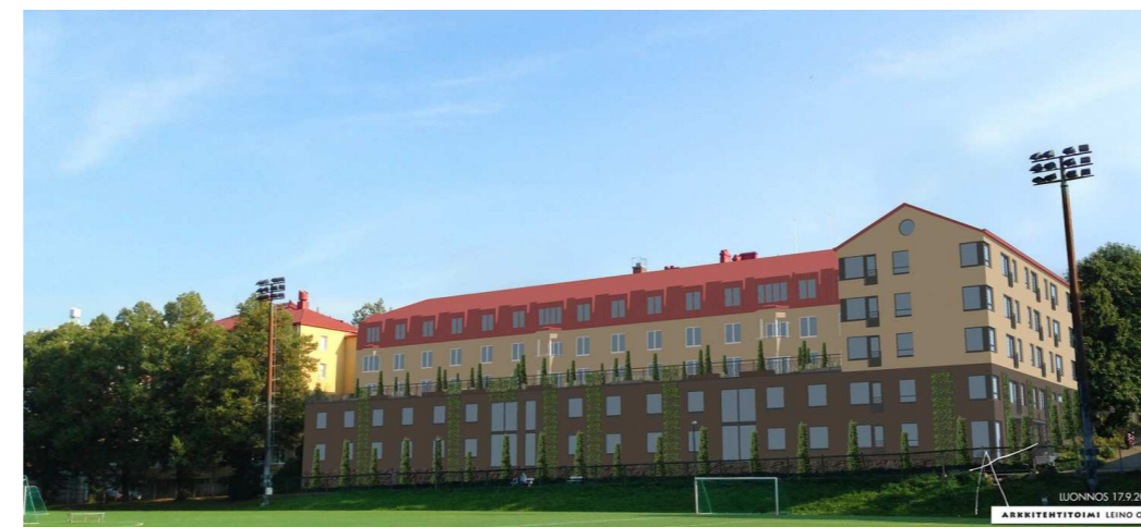
Havainnekuva Arkkitehtitoimi Leino Oy