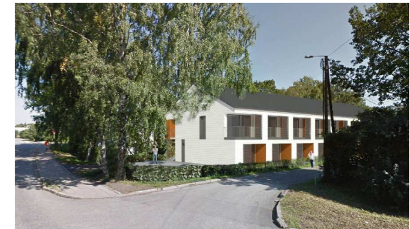
HAVAINNEKUVA SIGGE ARKITEHDIT

Poistuvan kaavan tunnus ja voimaantulopäivä.