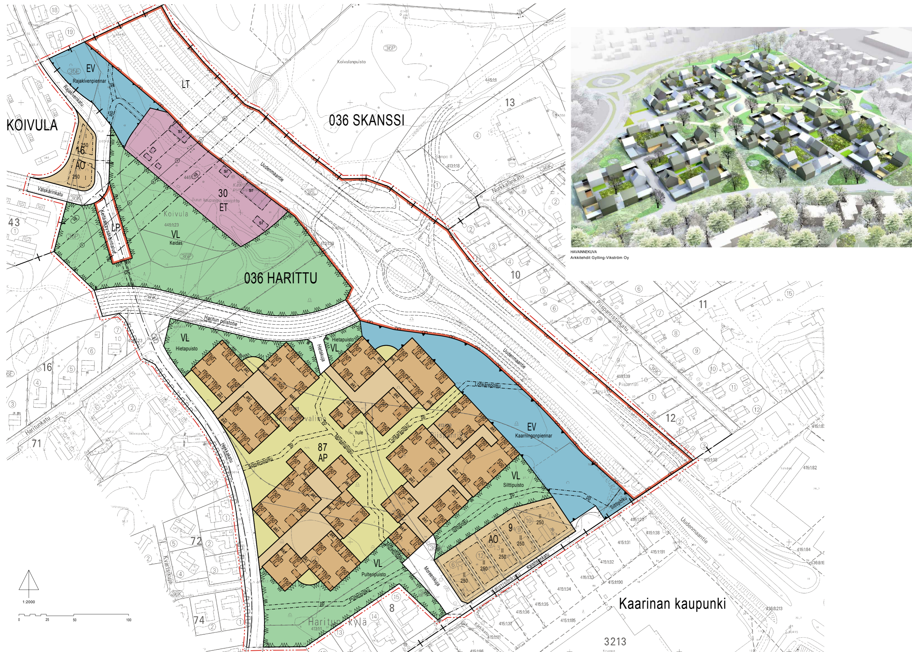
HAVAINNEKUVA Arkkitehdit Gylling-Vikström Oy