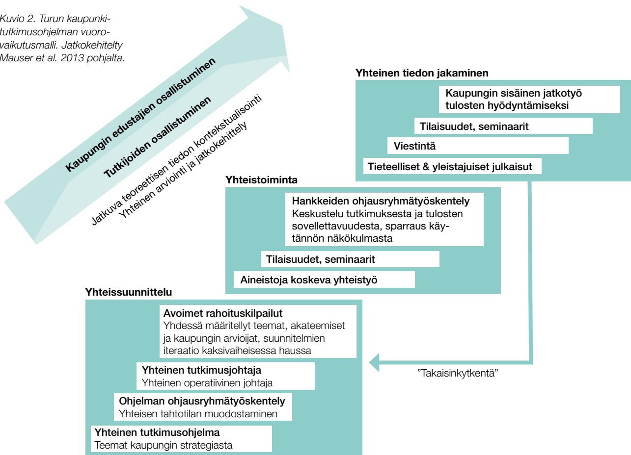
Kuvio 2. Turun kaupunkitutkimusohjelman vuorovaikutusmalli. Jatkokehittely Mauser et al. 2013 pohjalta.

sä puitteissa parhaiten kehittämistoimintojen analyttisinä sparraajina, kriittisinä vastavoimina sekä mediakeskustelun laajentajina ja syventäjinä. 14 Tutkimustiedon soveltaminen edellyttää myös kaupunkiorganisaation omaa perehtymistä ja pohdintaa. Yhteiskehittely toteutuu muodollisessa ja epämuodollisessa vuorovaikutuksessa prosessin eri vaiheissa. Mauser et al. on jakanut prosessin kolmeen osaan: yhteissuunnitteluun ( co-design ), yhteistoimintaan ( co-production ) ja yhteiseen tiedon jakamiseen ( co-dissemination ), joita kaikkia tarvitaan tutkimuksen yhteiskunnallisen vaikuttavuuden turvaamiseksi. 13 Turun kaupunkitutkimusohjelmassa on määritetöisesti kehitetty prosesseja, joilla turvataan osapuolten aktiivinen ja tavoitteellinen osallistuminen eri vaiheissa ja siten parannetaan tutkimustiedon vaikuttavuuden edellytyksiä (kuvio 2).