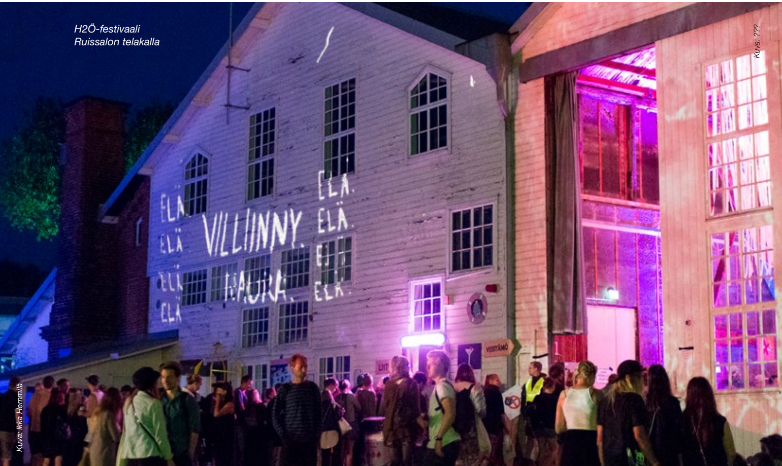
H2Ö-festivaali Ruissalon telakalla