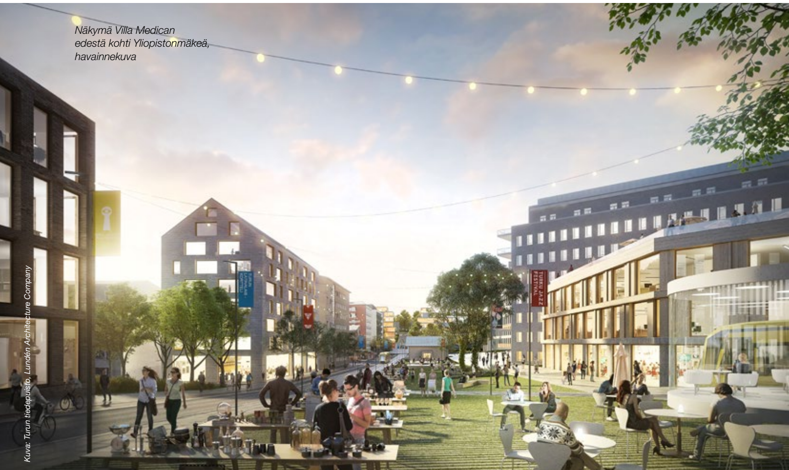
Näkymä Villa Medican edestä kohti Yliopistonmäkeä, havainnekuva

Kärkihankkeeseen voi linkittyä monipuolisesti yllä mainittuihin teemoihin liittyviä tutkimuksia, jotka liittyvät joko aihealueisiin liittyvien ilmiöiden ja niiden seuraussuhteiden jäsentämiseen, data-analytiikan sovellusmahdollisuuksiin sekä kaupungin toimimiseen uusia palveluja ja liiketoimintaa mahdollistavien digitaalisten alustojen tarjoajana.