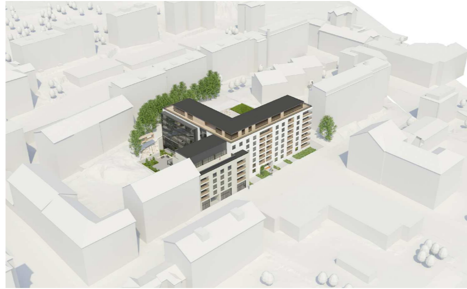
Näkymä idästä (Haroma & Partners Oy)