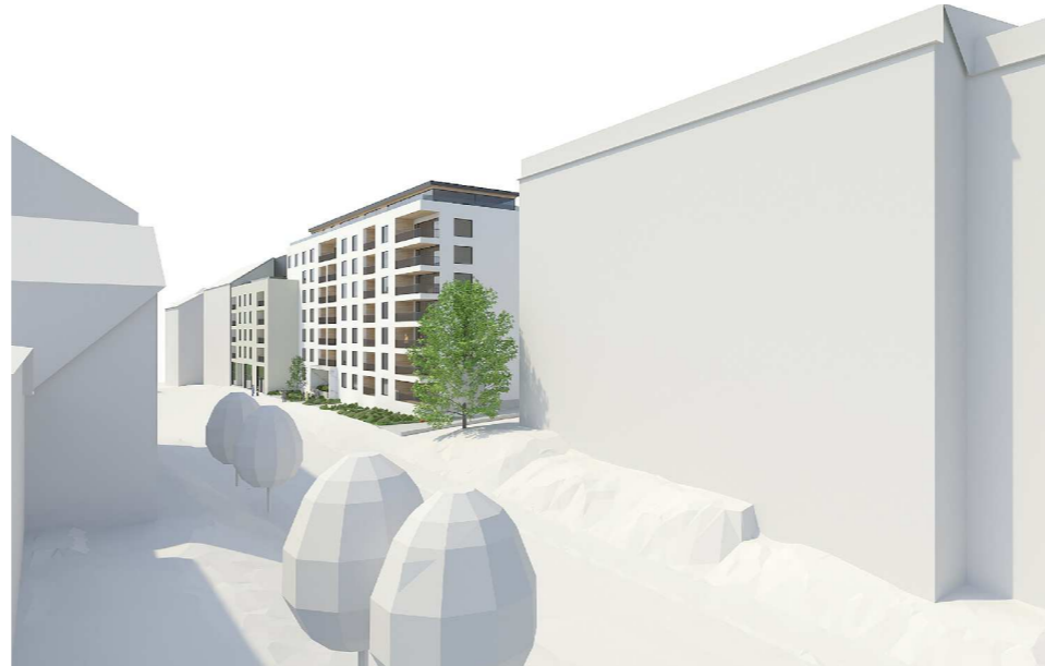
Näkymä Kellonsoittajankadulta luoteesta (Haroma & Partners Oy)