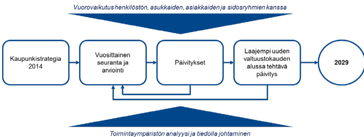
Kuva 2: Jatkuva parantaminen.

Strategia on kauaskantoinen suunnitelma, jonka avulla ohjataan kaupungin toimintaa. Johtamisen näkökulmasta pelkkä suunnittelu ei kuitenkaan vielä riitä, vaan tarvitaan systemaattista ja määräämuotoista sovittujen toimenpiteiden toteutusta sekä saavutettujen hyötyjen arviointia. Jatkuva parantaminen etenee vuosittain toistuvana prosessina, jossa toimenpiteiden toteutus, hyötyjen arviointi sekä päämäärien, keinojen ja toimenpiteiden tarkentaminen seuraavat toisiaan. Hyötyjen arviointia tehdään tiiviissä ja avoimessa yhteistyössä kaupungin henkilöstön, asukkaiden, asiakkaiden ja sidosryhmien kanssa.