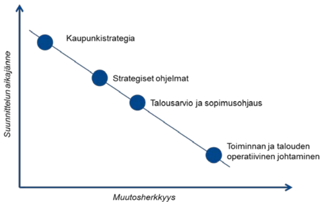
Kuva 3: Strategisen suunnittelun aikajänne ja muutosherkkyys.

periaatteet. Keskeisenä ohjenuorana toimivat kaupungin toimintamallin tavoitteet: parempi johtaminen ja päätöksenteko, asukas- ja asiakaslähtöisyys sekä tuottavuus ja uudistuminen.