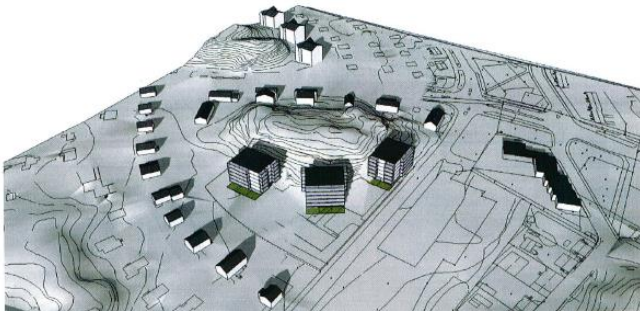
Schauman Arkkitehdit Oy

Aloitteen asemakaavan muuttamiseksi on tehnyt tontin omistaja Kiinteistö Oy Turun Vähäheikkiläntie 37. Hakija on teettänyt suunnitelman, jossa tontille sijoittuu kolme 6-kerroksista asuinkerrostaloa.