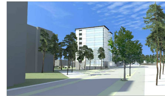
Havainnekuva Munterinkadulta /Arkkitehtitoimisto C&Co Oy