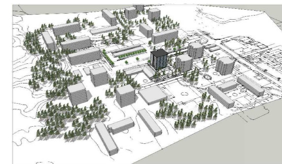
Havainnekuva lännestä /Arkkitehtitoimisto C&Co Oy