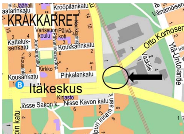
Nurkkapuisto, kaavanmuutoksen alla oleva tontti